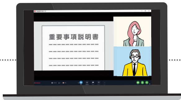
重要事項説明時のパソコン画面イメージ